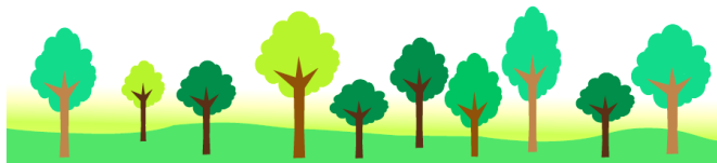
村上 西澤 吉松 山口 山内 鈴木 竹内 馬場