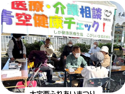
大宝西ふれあいまつり