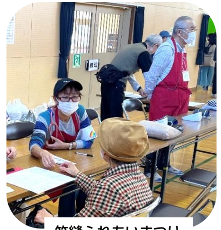
笠縫ふれあいまつり

10月から11月にかけて、各地域でまつりが開催され、支部運営委員や健康づくり委員と、診療所や訪問看護ステーションの職員が中心となり、健康チェックを行いました。 3つの地域のふれあいまつりに参加した草津北支部では、それぞれに30人以上の参加者があり、栗東支部でも、10人以上が参加されました。 草津東支部では、渋川学区社協からの依頼を受け、今年も5カ所で開かれた高齢者サロンに参加することができました。