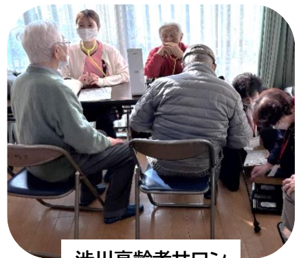
渋川高齢者サロン