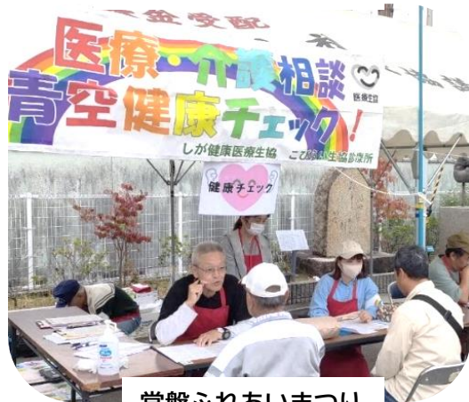
常盤ふれあいまつり